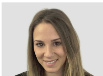
Ydania Claims Consultant