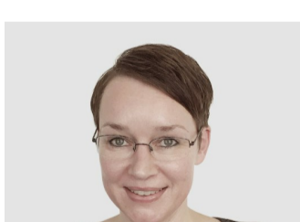
Caroline Customer Consultant